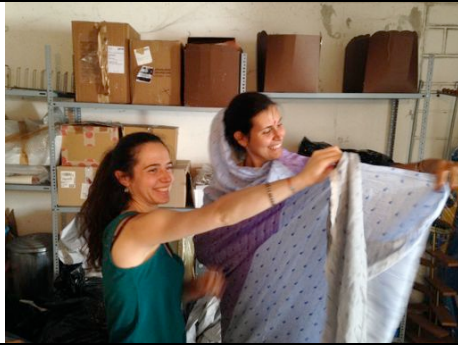
Volontarie di Associazione Mauja al lavoro (le stoffe donate saranno utilizzate per l'abbellimento delle stanze del personale di progetto)