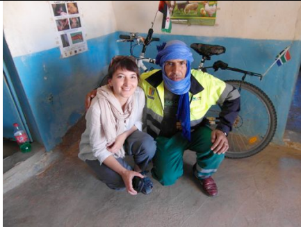
Visita alla Direzione Veterinaria di Dajla