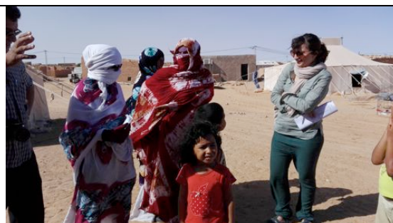
Visita alle beneficiarie dell'attività di semina di Moringa (Auserd – Tichla)