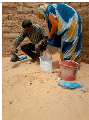
Installazione dei protettori metallici e del sistema di irrigazione