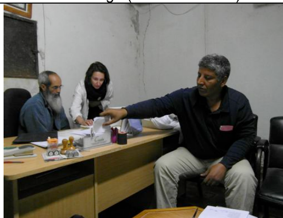
Riunione con il Direttore e con il veterinario incaricato dell'allevamento di ovaiole