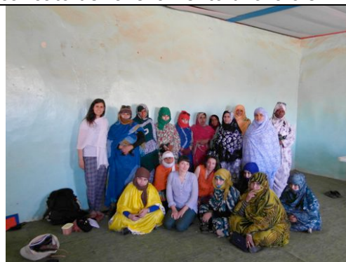
Riunione con alcune donne beneficiarie dell'attività di rafforzamento di attività generatrici di reddito