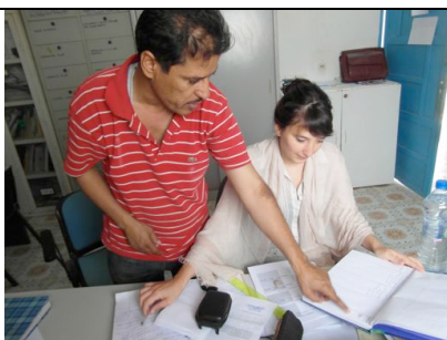
Visita alla Direzione Centrale di Veterinaria: controllo registri di attività

cui abbiamo seminato la Moringa ed ha incontrato una rappresentanza delle donne che saranno formate e supportate nel miglioramento di attività generatrici di reddito legate alla trasformazione e vendita di alimenti. In soli sette giorni non è stato facile, ma ce l'abbiamo fatta.