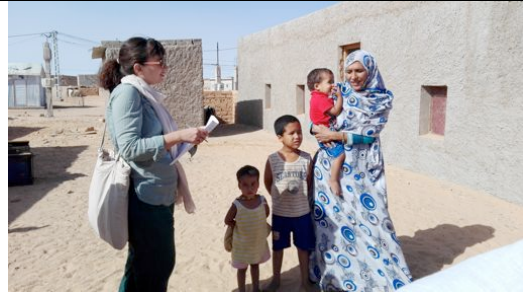
Somministrazione di questionari alle beneficiarie della semina di Moringa