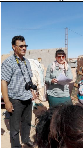
Visita alle beneficiarie dell'attività di semina di Moringa (Auserd – Tichla)