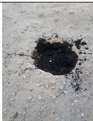
Preparazione terreno con torba per la semina

Ogni visita è stata occasione per rispondere ai dubbi delle famiglie, per correggere gli errori d’irrigazione e per rinforzare il messaggio legato al potenziale nutrizionale delle foglie. Intanto stiamo preparando nel Centro Experimental de Formacion Agricola un vivaio. Gli alberi che vi cresceranno saranno trapiantati presso le famiglie beneficiarie a fine settembre per sostituire quelli eventualmente danneggiati da difetti d’irrigazione nel periodo estivo.